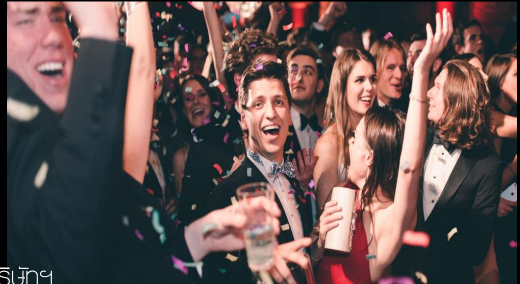
Lady & Gentleman

ขอเรียนเชิญทุกท่านเข้าสู่ช่วงเวลาแห่งความสุข ให้ ท่านได้ดื่มด่ำกับปาร์ตี้ส่วนตัว แต่เติมความทรงจำ แสนพิเศษด้วยธีมปาร์ตี้ที่ท่านสามารถกำหนดได้เอง พร้อมบริการช่างภาพคอยบันทึกภาพความประทับใจ