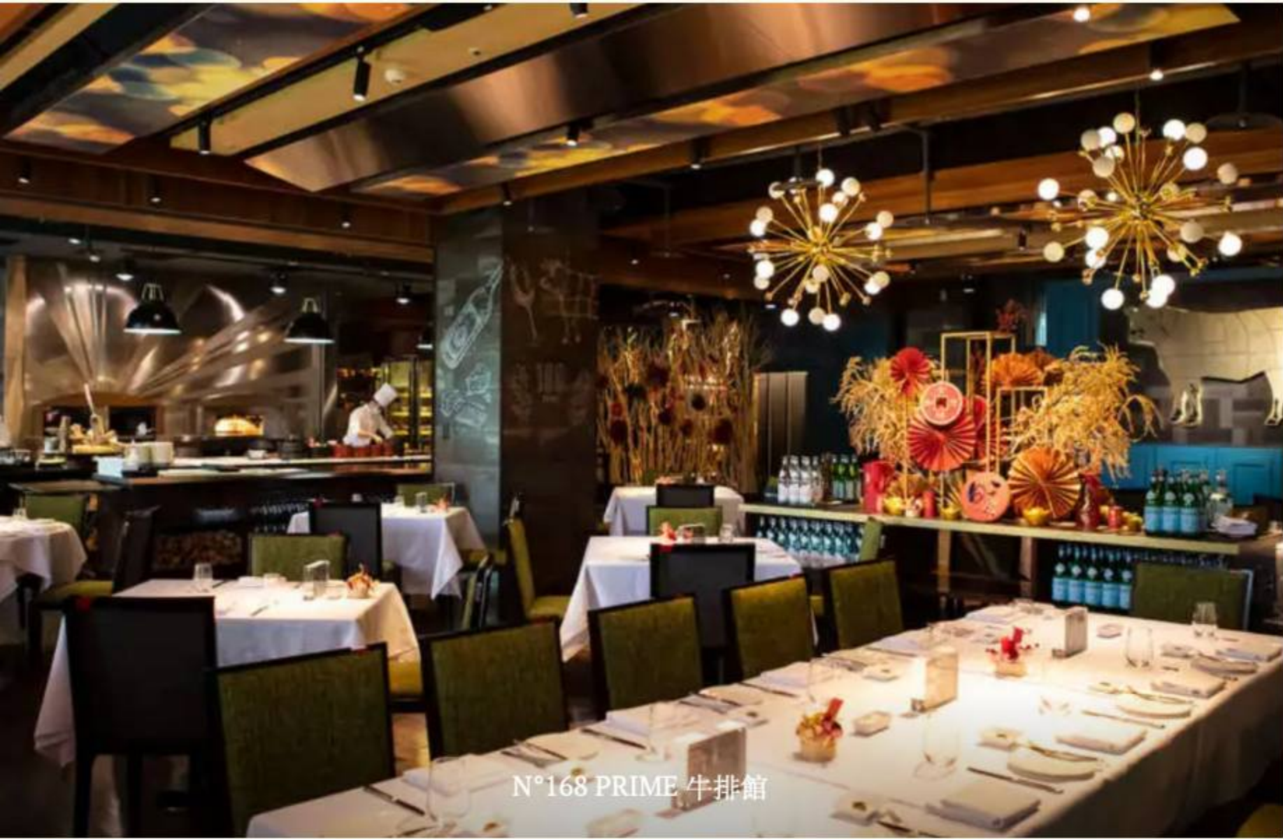
N°168 PRIME 牛排館