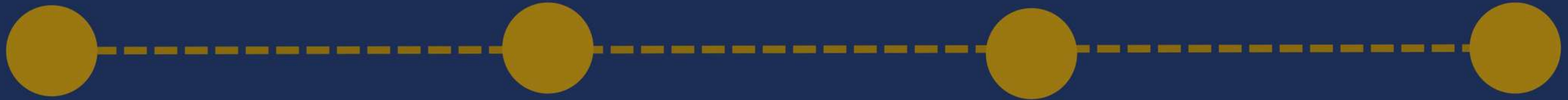
MAN MO TEMPLE